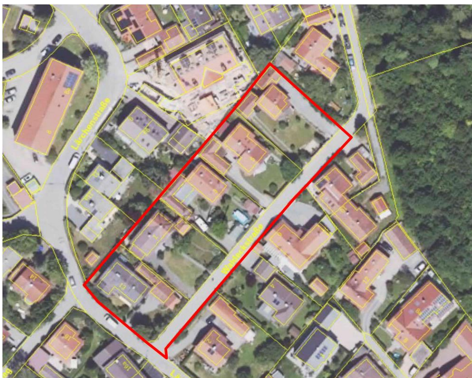
Orthophoto der Bayerischen Vermessungsverwaltung; rote Linie: Plangebiet des Bebauungsplanes Nr. 91 "Waldeckstraße"

Das ca. 0,43 ha große Plangebiet umfasst die nördlich der Waldeckstraße gelegenen Grundstücksflächen, deren südlicher Teil aktuell nur mit untergeordneten Gebäuden bebaut ist. Das Plangebiet selbst ist von einer bereits maßvoll nachverdichteten Wohnbebauung eingerahmt.