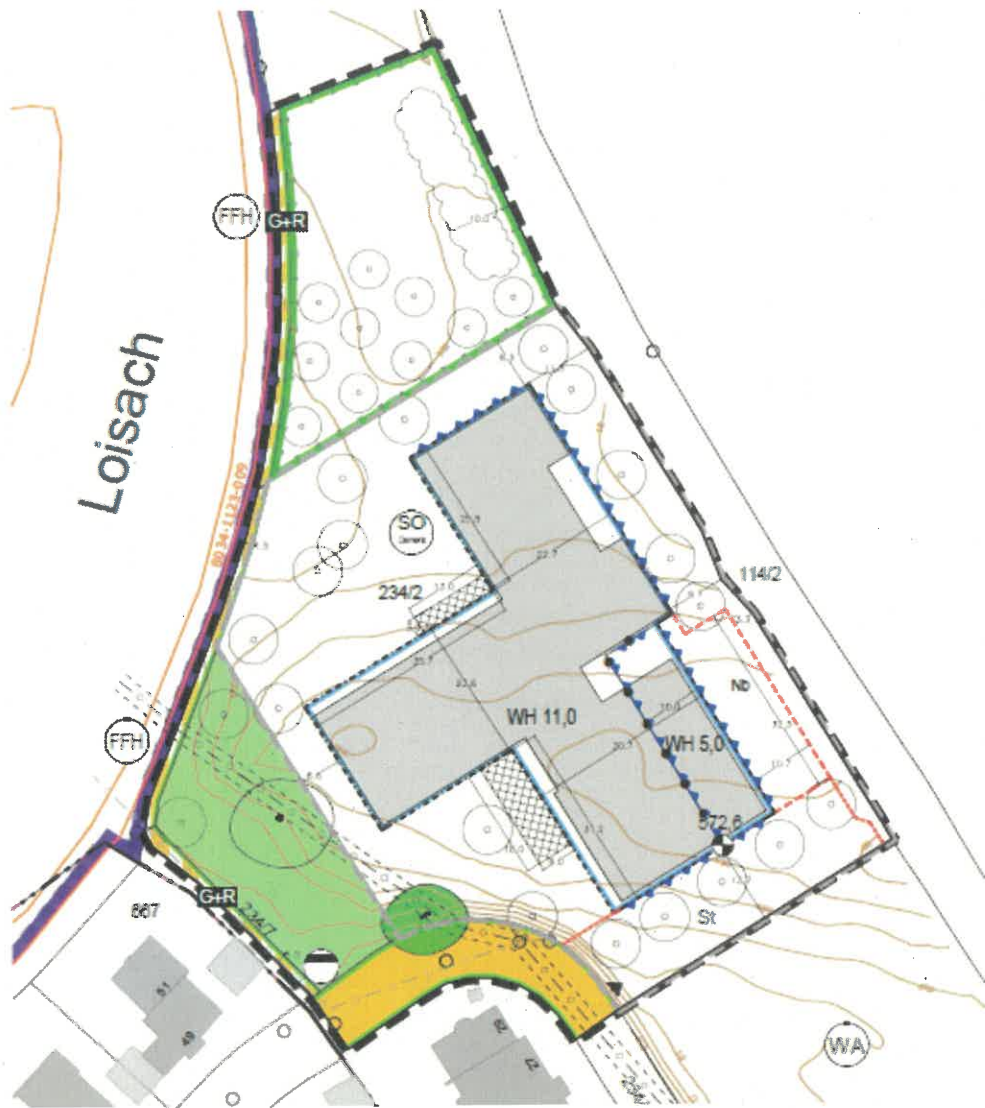
Geltungsbereich des Bebauungsplan Nr. 87 „Demenzzentrum“ – ohne Maßstab

Der Planentwurf besteht aus einem Planteil, textlichen Festsetzungen, einer Begründung mit Umweltbericht und Anlagen (Gutachten) sowie Vorhaben- und Erschließungsplänen.